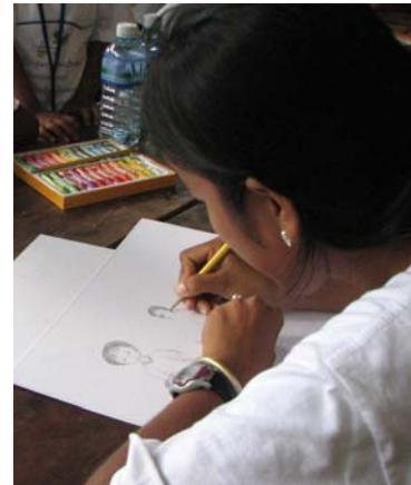
Concours de dessin

Les participants avaient un temps limité à deux heures pour dessiner ou rédiger leurs poèmes.