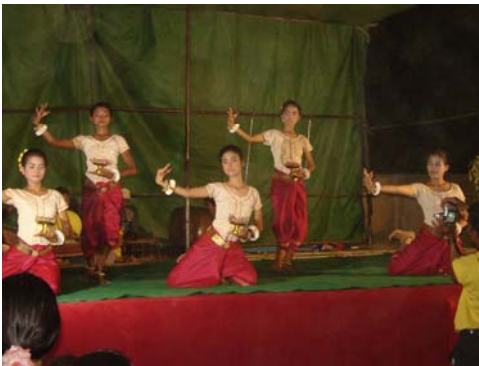
Danse de bénédiction