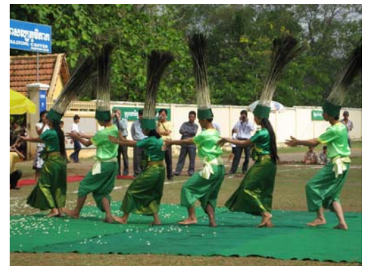
La danse du paon par nos danseurs sourds

L'après midi a débuté avec de nouveaux discours mais cette fois-ci, les enfants étaient au micro : enfants scolarisés ou ayant trouvé du travail, enfants ayant pris leur envol... Ces discours étaient plus des témoignages dans lesquels les enfants exprimaient aussi bien leur joie et leur gratitude envers Krousar Thmey que leurs histoires personnelles.