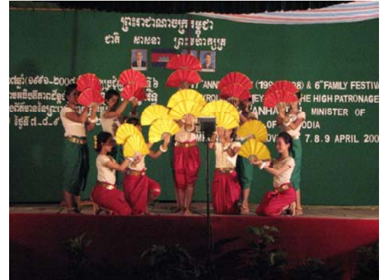
Danse des éventails

Et pour terminer la journée, tout le monde s'est réuni pour une soirée dansante . Ce petit plaisir de fin de journée sera bien sur reconduit tous les soirs !