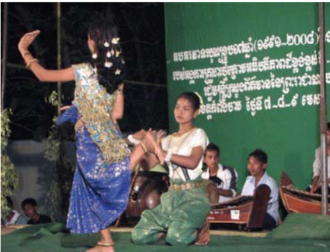
Danse Mony Mekala par le centre de protection de Sisophon

Le deuxième jour s'est terminé par d'autres danses traditionnelles, suivi de la très attendue soirée dansante.