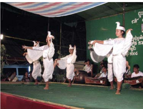
Danse des pigeons, par les enfants du centre de protection de Takhmao