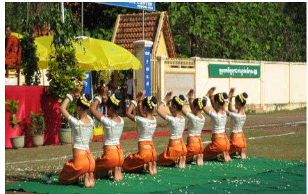
Danse de la bénédiction

Entre les discours de Benito, Mr khiev Kanharith et autres, la danse traditionnelle de bénédiction a été réalisée avec beaucoup de grâce, par les enfants de l'école d'arts de Sisophon.