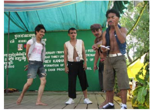
Show théâtral par des enfants sourds