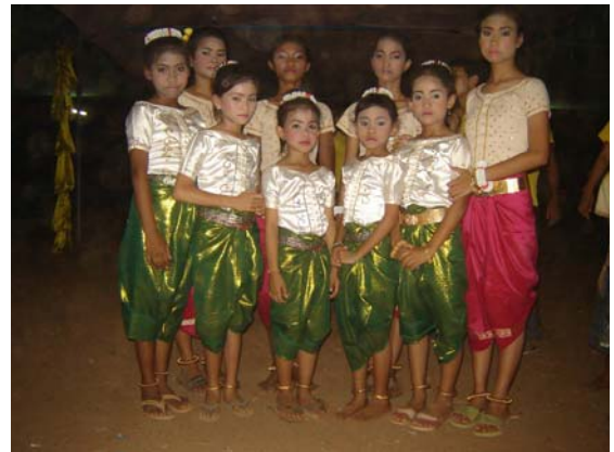
Danse des Fleurs

Cette dernière a été réalisée par les jeunes sourds de l'école de Siem Reap, avec seulement 5 mois d'entraînement !