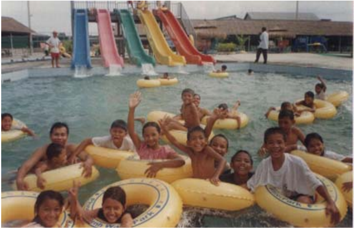
Les enfants du centre de Chamcar Mon s'amuse comme des fous dans les piscines de Water Park.

Les sourires et la joie de vivre de ces enfants sont une récompense à nos efforts communs.