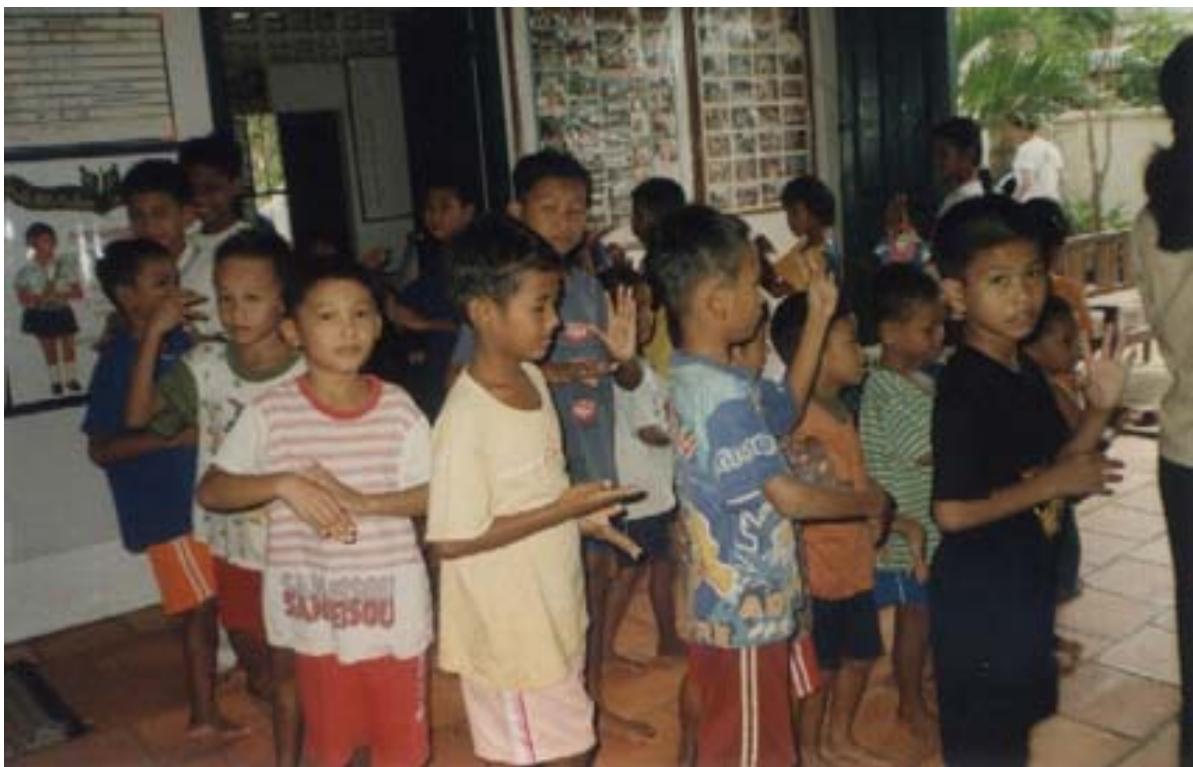
Les enfants sont très attentifs au rythme de la musique afin de perfectionner leurs gestes.

Tous les mercredis après-midis, de 14h00 à 15h00, tous les enfants ont une heure de cours de danse. Les enfants s'amuse bien sur le rythme des danses populaires. Guidés par une éducatrice qui a été formée pendant deux semaines par l'ONG Cambokid , ils lèvent les bras et gesticulent en fonction de la cadence de la musique. Ces séances sont pour les enfants de vrais moments de détente qui leur permettent d'évacuer une partie de leurs tensions intérieures.