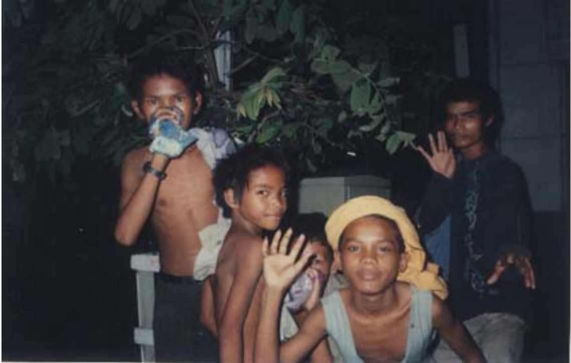
Phnom Penh: de plus en plus de jeunes enfants des rues sniffent de la colle.