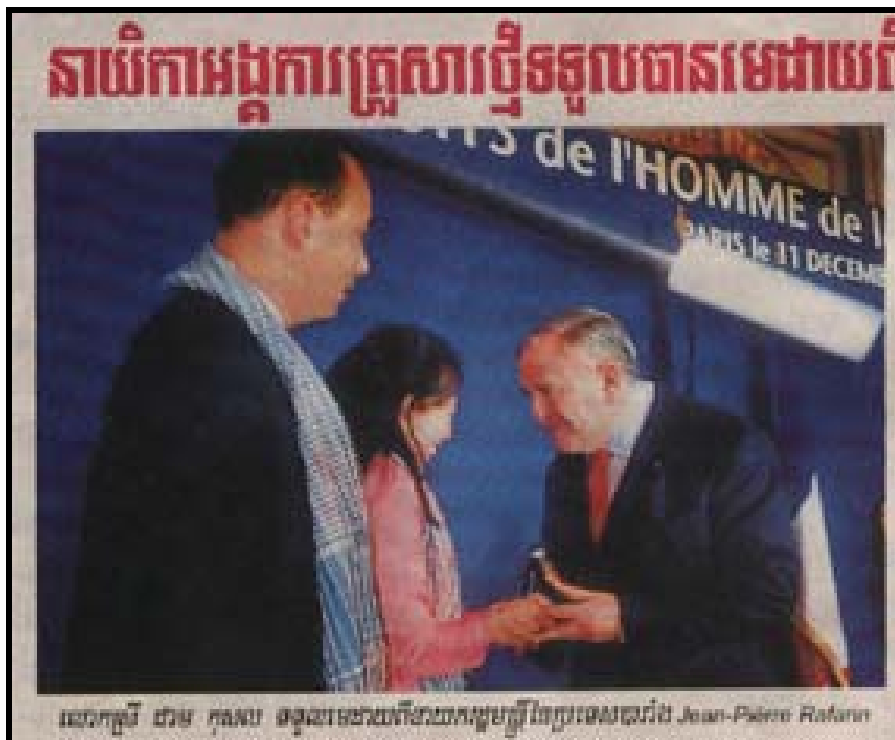
Article tiré du quotidien Khmer Kampuchea Thmey Daily du 8/01/04.

Aujourd'hui 20 mères et 81 enfants habitent le village.